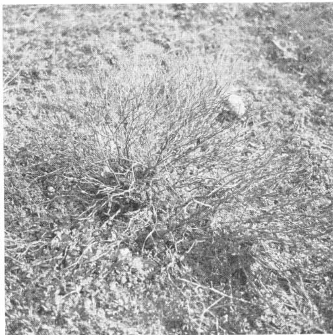
Fig. 4 - L'esemplare bruciato in macchia aperta in ricostituzione dopo abbandono di pratiche agrarie. Notare alla base i nuovi germogli.

In questa «gariga aperta» sono presenti Thymus capitatus HOFFMGG. et LK., Cistus salvifolius L., Myrtus communis L.,