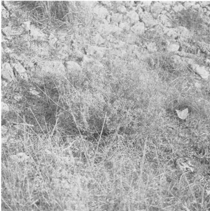
Fig. 3 - L'esemplare in posizione prossima alla duna nella zona della Vecchia Salina (T. Columena).

sabbia a circa 30 metri dal mare in un punto ove la duna litoranea a ginepri si interrompe per lasciare il posto ad un tratto di costa rocciosa, l'altro a circa mezzo chilometro di distanza ai margini della strada litoranea, al limite di un coltivo abbandonato ricolonizzato da una bassa gariga la cui evoluzione potrebbe portare ad una macchia degradata analoga a quella rilevata nel 1968, il cui rilievo è riportato in appendice nel lavoro di CHIESURA LORENZONI, CURTI, LORENZONI, MARCHIORI (1974-75). Mentre il primo risultava, al momento del ritrovamento, in rigogliosa vegetazione, tanto che non solo aveva portato a termine la fruttificazione, ma sotto la pianta madre alcuni semi erano germinati, il secondo era stato bruciato insieme agli altri arbusti. Durante i successivi accertamenti nei mesi seguenti, si poté però verificare che il secondo esemplare stava rivegetando, per l'emissione di radici avventizie ai nodi dei rami prostrati. Questo fenomeno è normale per la pianta (LITAV e ORSHAN, 1971).