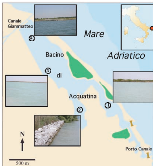
Fig. 1 - Localizzazione delle stazioni di campionamento nel Lago di Acquatina. Nel riquadro, localizzazione di Acquatina in Italia (puntino rosso).

I prelievi di macroalghe e fanerogame sono stati condotti nel luglio 2006 e nel marzo 2007, in immersione in quattro stazioni con caratteristiche differenti (Fig. 1). La stazione 1 è la più vicina al mare, con il quale comunica, dopo l'interramento del canale principale, attraverso un canale poco profondo largo 15 m e lungo circa 400 m. La stazione 2 è la più confinata, situata nel braccio che si protende verso sud, chiamato "ansa di Frigole". La stazione 3 è posizionata al centro del bacino ed è caratterizzata dalla presenza di substrato mobile, ma sono stati campionati in corrispondenza anche i substrati duri lungo la costa. La stazione 4 è localizzata in prossimità del canale Giammatteo, vettore di acque dolci. La raccolta del materiale è stata effettuata alla profondità di circa -0,5 m. Solo nella stazione 3 è stato possibile un ulteriore prelievo a -1,5 m.