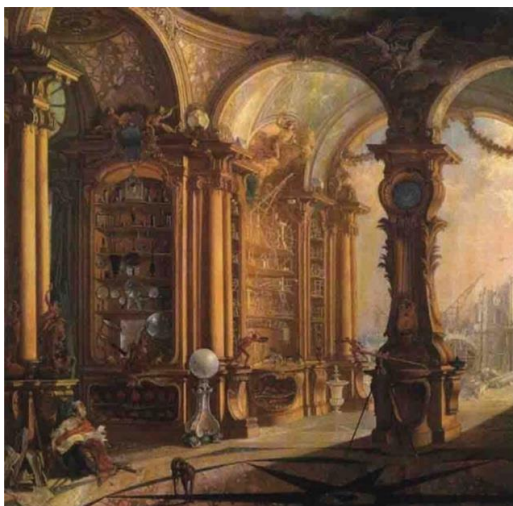
Fig. 2 Jacques de Lajone, Il gabinetto di fisica de Bonnier de La Mosson , Blessington, Irlanda.

presenti in Città appartenenti all'élite sociale (nobili, funzionari pubblici), a medici e studiosi, dilettanti e professionisti, e che l'ascia della Rivoluzione provvederà a confiscare e disperdere nel loro assetto unitario 6 .