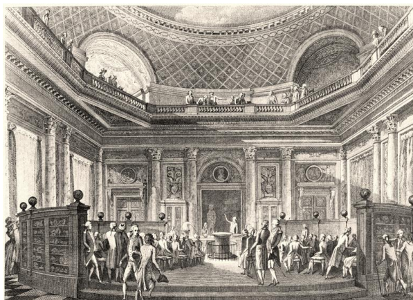
Fig. 8 A. Seba, Locupletissimi rerum naturalium thesauri , 1734-1765.

conservazione degli esemplari anatomici, patologici e zoologici messa a punto