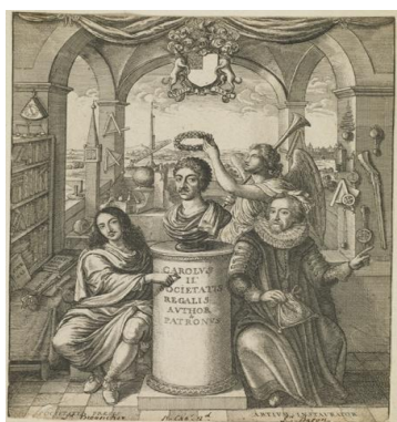
Fig. 5 Antiporta, T. Sprant, History of the Royal Society , 1677.

Il termine "museo", identificativo di un luogo per la conservazione e l'esibizione di una collezione volta alla conoscenza, ricorre nel poco più tardo Museum regalis societatis del 1685, cioè il catalogo della ricca collezione naturalistica della Royal Society