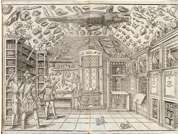
Fig. 4 Veduta del museo di Ferrante Imperato, F. Imperato, Historia naturale , 1599.

osservare, descrivere e comparare i reperti naturali in una nuova visione e lettura del cosmo, proporre descrizioni di ciò che oggi definiamo “biologia della specie” in un contesto geografico (dal Vecchio al Nuovo Continente), 11 senza però aderire alla metodologia linneiana che intanto si era imposta 12 : “Circa al modo di collocare, e di esporre vantaggiosamente i diversi pezzi di Storia Naturale, credo che vi sia sempre luogo a far nuova scelta; vi son varie maniere che possono essere egualmente opportune le une che le altre per un medesimo oggetto, e in tal caso il buon gusto dee servir di regola” 13 .