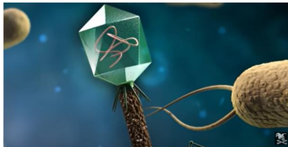
Figg. 3 e 4

Il capsid –continua lo youtuber - è connesso ad una sorta di cannuccia che termina con delle zampettine. La descrizione attraverso i paragoni e l'uso di termini connotativi (zampettine) sicuramente sarà registrata nelle menti dei ragazzi in maniera piana, senza particolari sforzi.