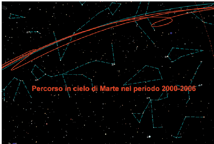
Figura 1: Percorso di Marte nel periodo 2000-2006

Il naturale buio della notte, aveva permesso agli antichi astronomi Babilonesi ed Egizi, di studiare con grande accuratezza l'evolversi delle stagioni, gli spostamenti del Sole tra le stelle e di ideare quel calendario di 365 giorni che tutt'oggi utilizziamo. Ciò che riusciva loro incomprensibile era il moto dei pianeti, niente affatto regolare e con traiettorie imprevedibili (v. Fig.1).