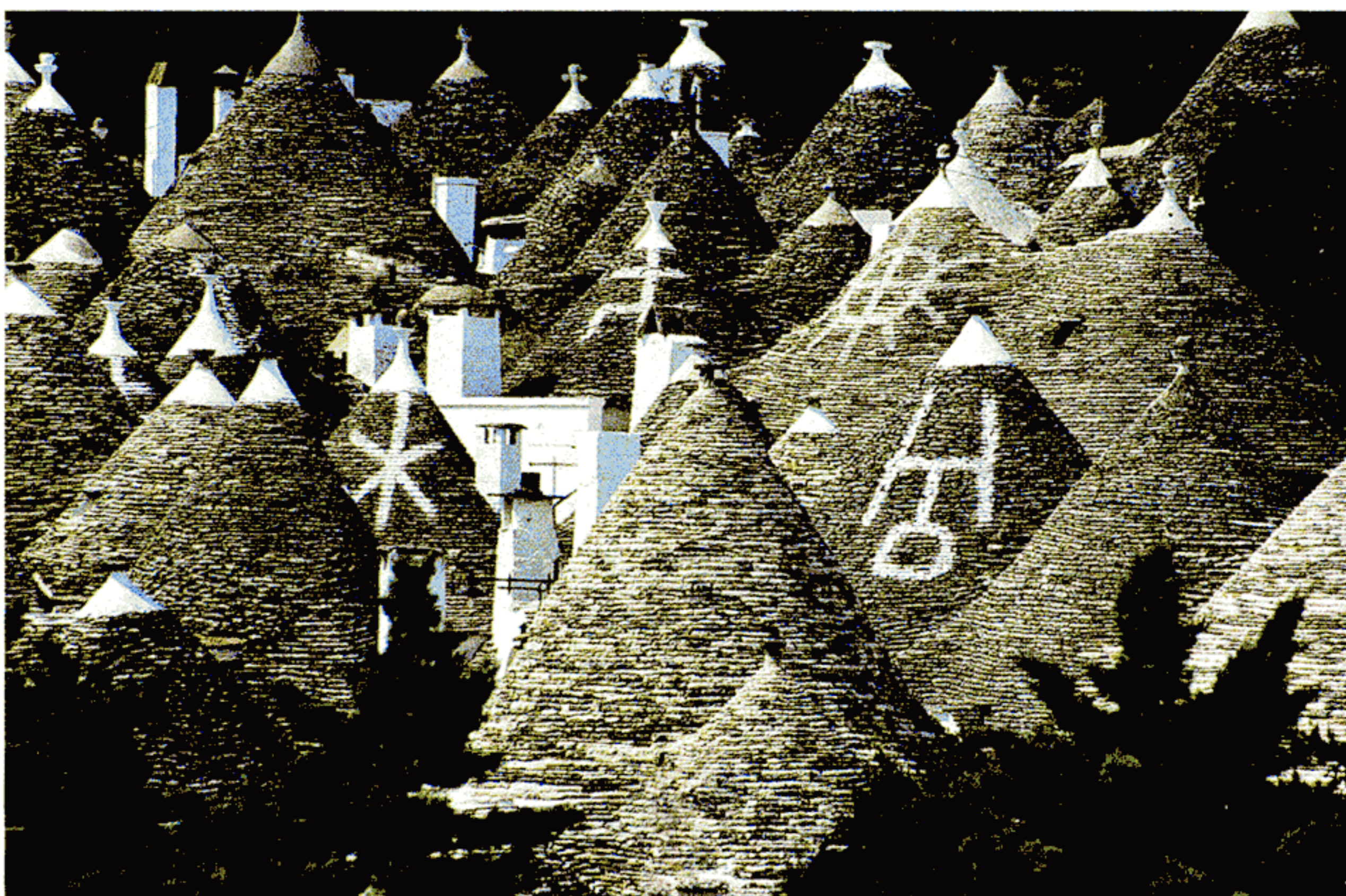
Simboli di riconoscimento sui trulli di Alberobello (BA).