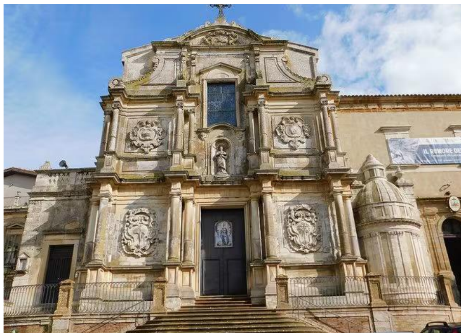
Figura 3. Foto della Chiesa barocca di San Francesco a Caltagirone