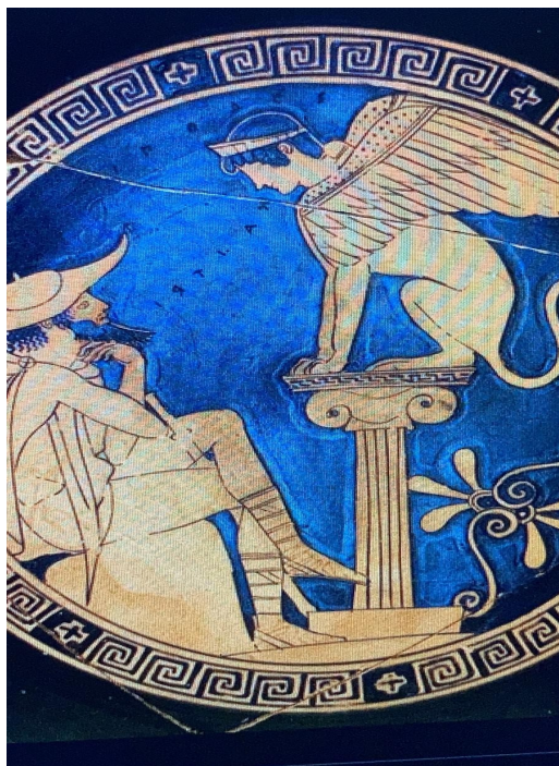
fig. 1 - Mus. Vat. 16541

TRIPODES. Edipo stesso è rappresentato sulla kylix come tripede (con il bastone in mezzo alle gambe e mentre, sorreggendosi il mento con una mano, nell'atto di pensare, cerca di risolvere l'indovinello della Sfinge). Sembra insomma che questo mito, che nasce da un enigma e che genera enigmi, fosse diventato una vera e propria sciarada per gli antichi.