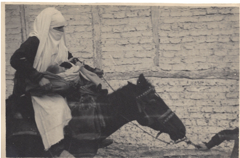
fig. 2 - Donna musulmana con il proprio bimbo