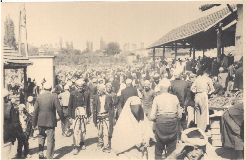
fig. 23 - La folla al mercato di Gjakova