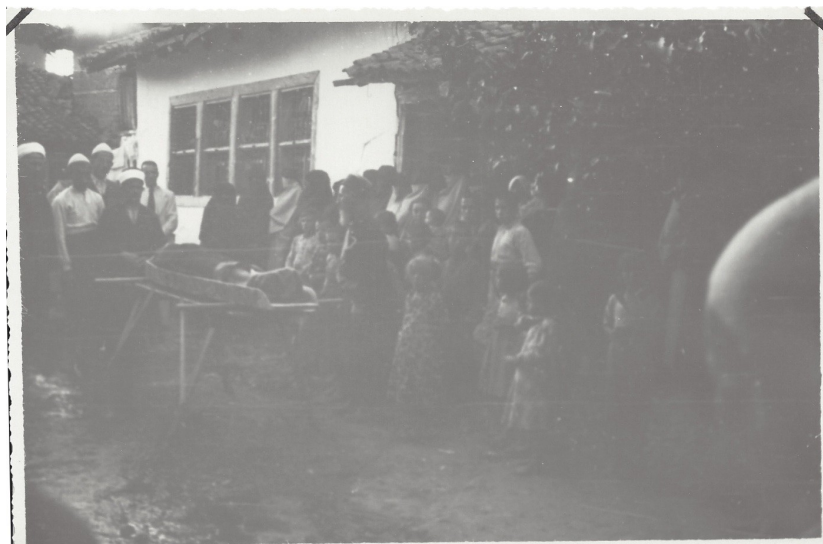
fig. 8 - Scena di funerale