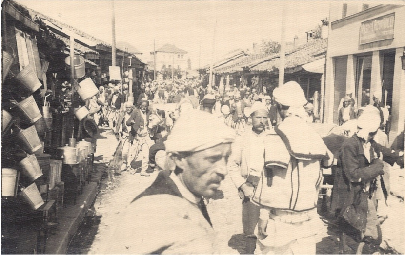
fig. 22 - La folla al mercato di Gjakova