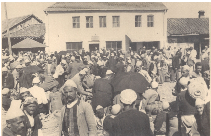
fig. 17 - Gente al mercato