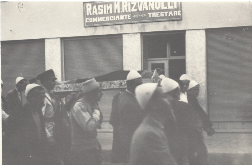
fig. 7 - Funerale musulmano a Gjakova