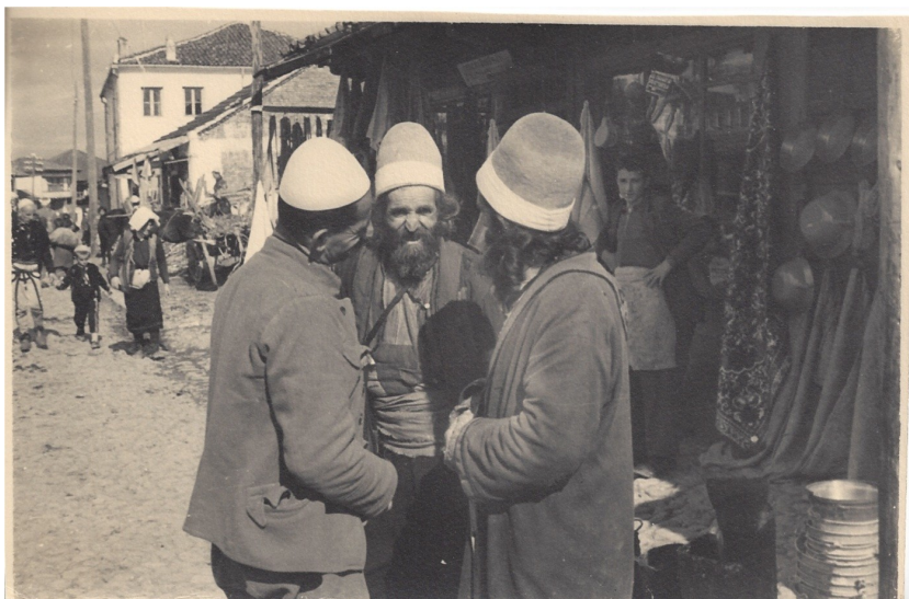
fig. 28 - Uomini al mercato