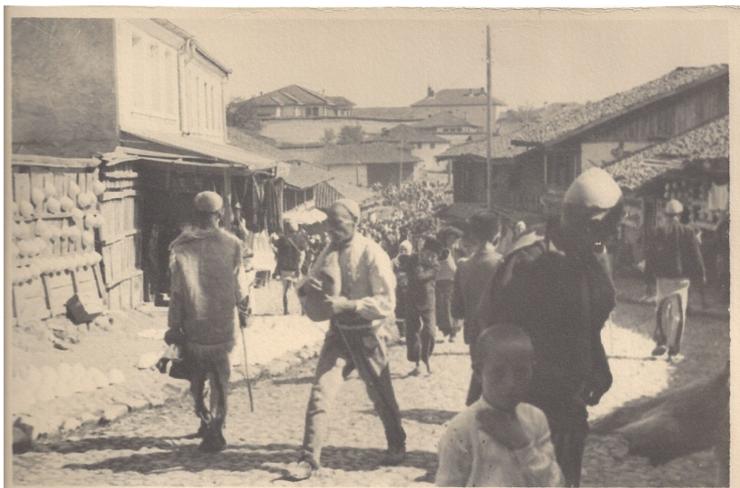
fig. 24 - La folla al mercato di Gjakova