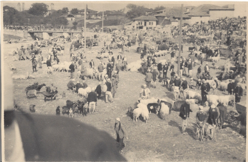
fig. 19 - Mercato del bestiame