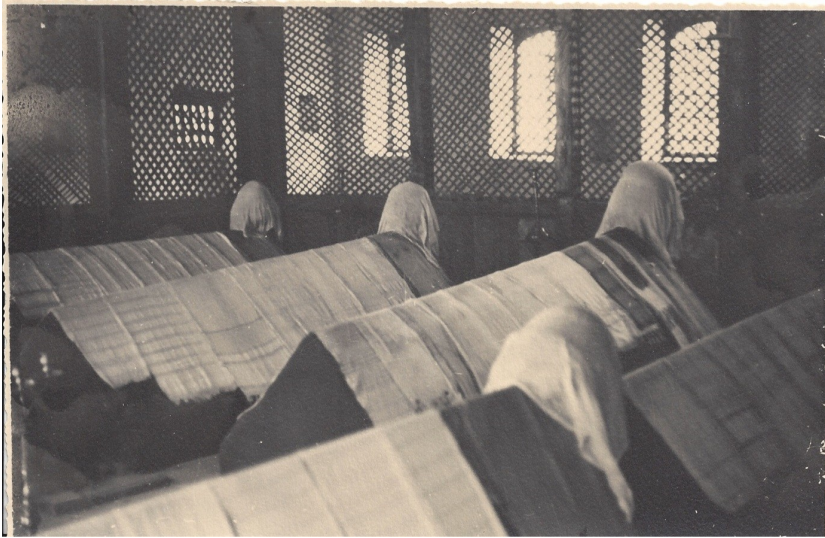
fig. 10 - Le tombe dei "santoni" nella moschea di Prizren