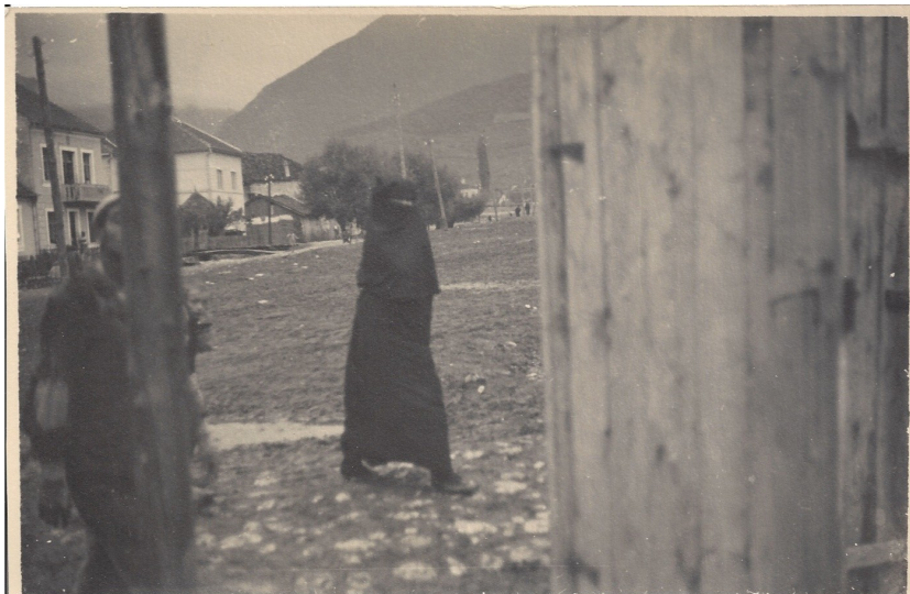
fig. 12 - Scene di vita rurale nei pressi di Gjakova