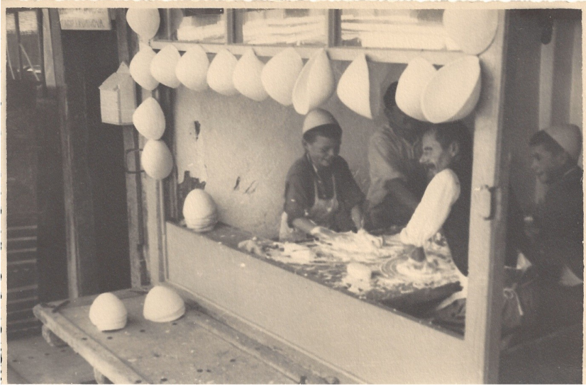
fig. 6 - Panificatori di Gjakova