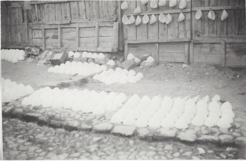
fig. 18 - Vendita dei copricapi