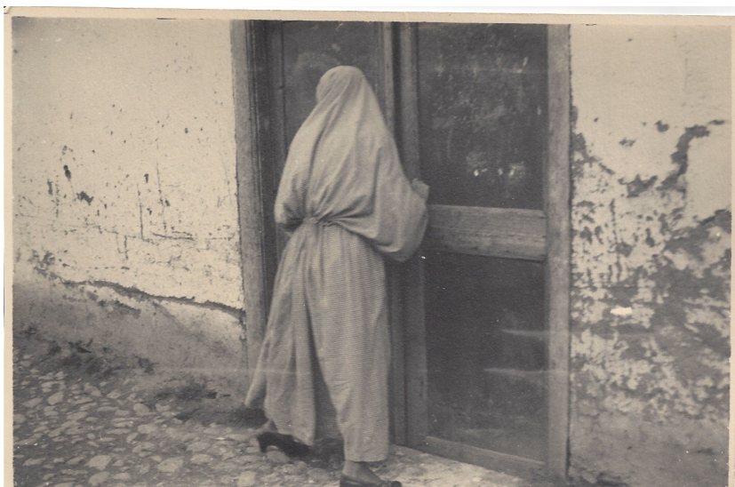
fig. 21 - Una donna col velo