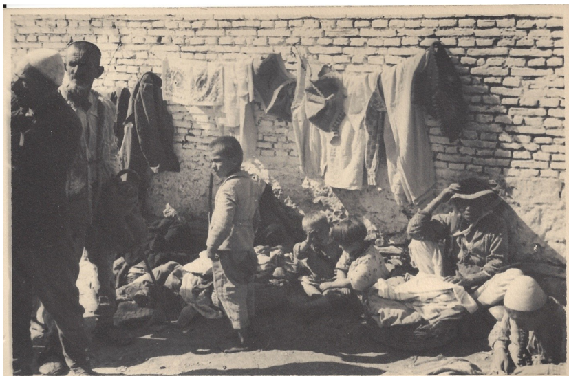
fig. 20 - Bambini al mercato