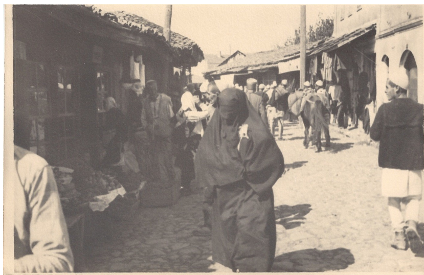
fig. 9 - Donna col velo a Gjakova