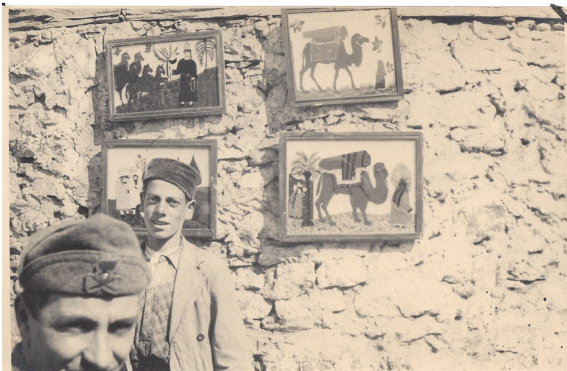
fig. 1 - Artigianato kosovaro a Giakova