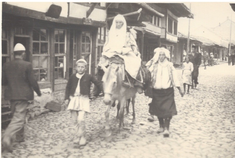
fig. 16 - Gente al mercato