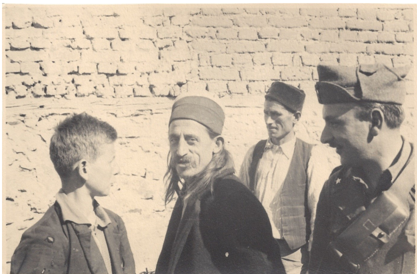
fig. 25 - Uomini di Gjakova