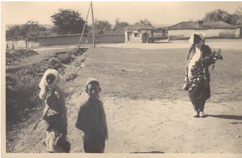
fig. 11 - In campagna