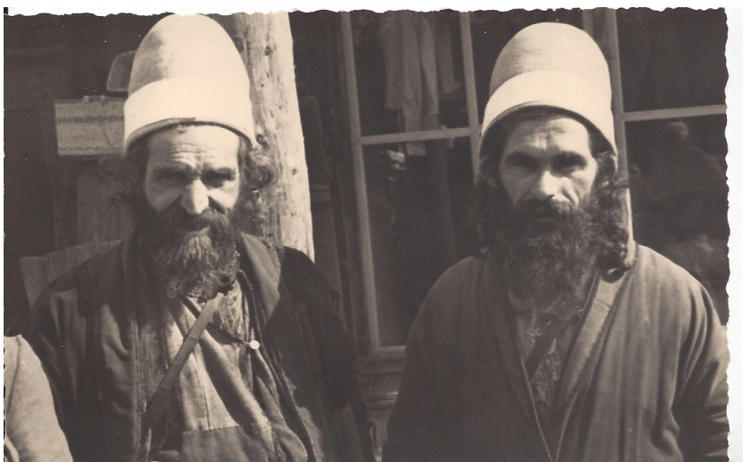
fig. 29 - Uomini al mercato