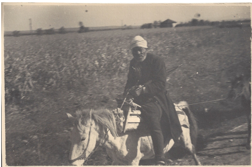
fig. 13 - Scene di vita rurale nei pressi di Gjakova