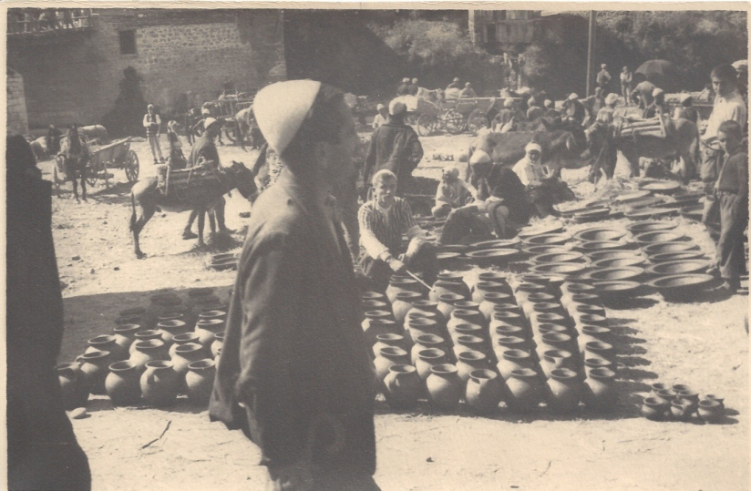
fig. 15 - Artigiani al mercato di Gjakova