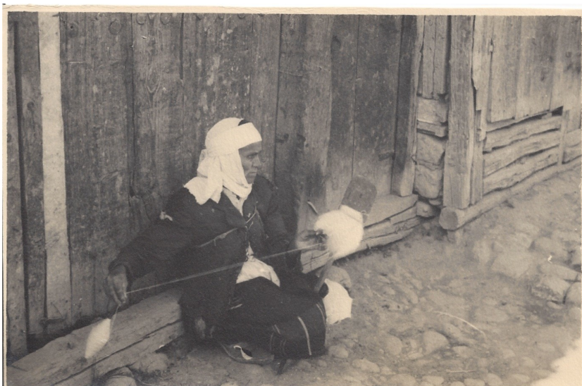
fig. 5 - Filatrice al mercato