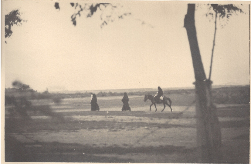
fig. 14 - Scene di vita rurale nei pressi di Gjakova