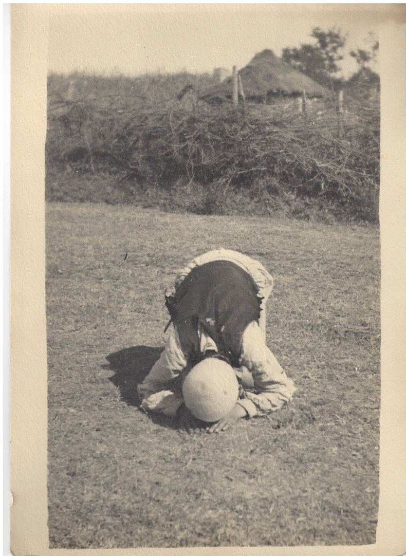
fig. 27 - In preghiera