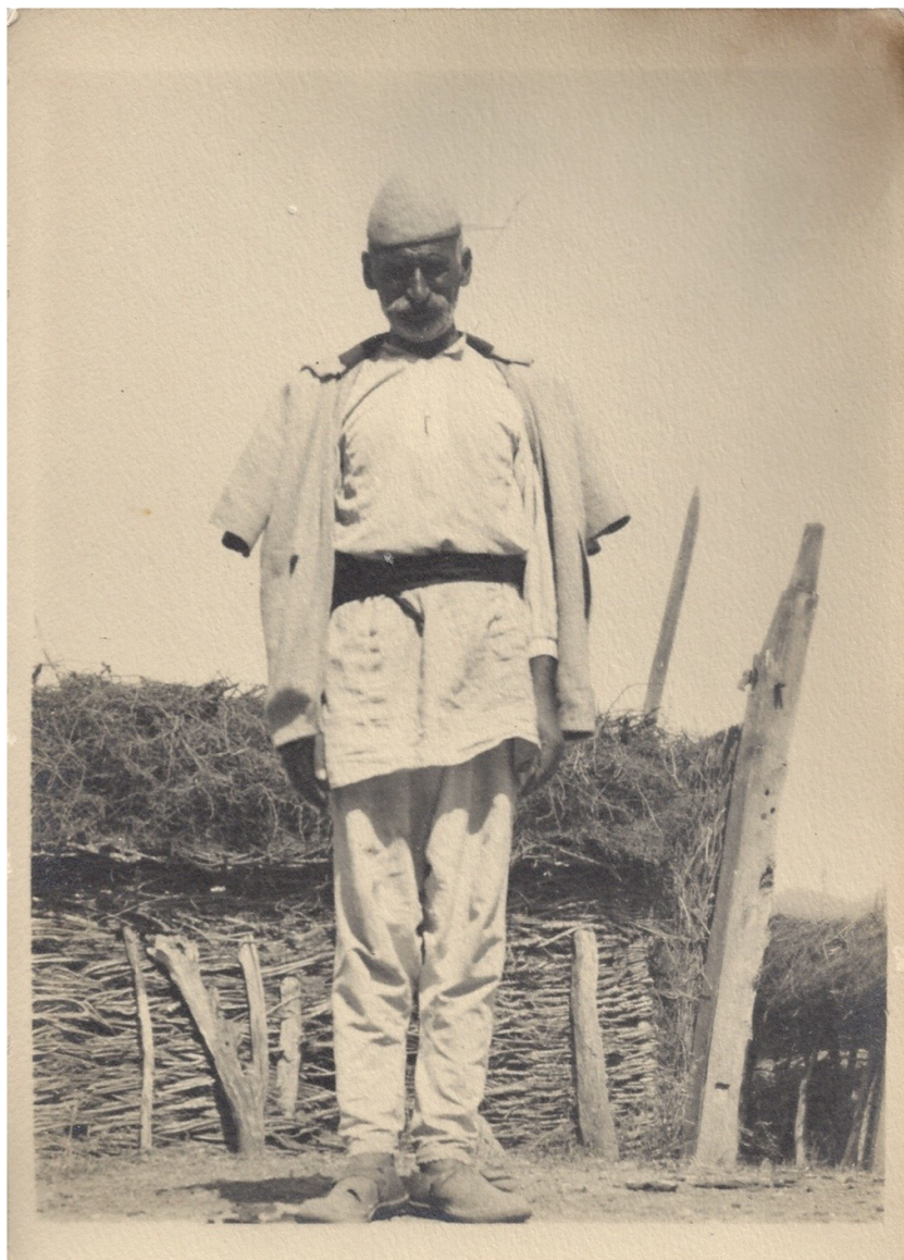
fig. 26 - Anziano kosovaro