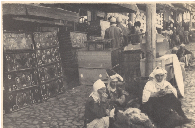
fig. 4 - Venditrici al mercato di Gjakova