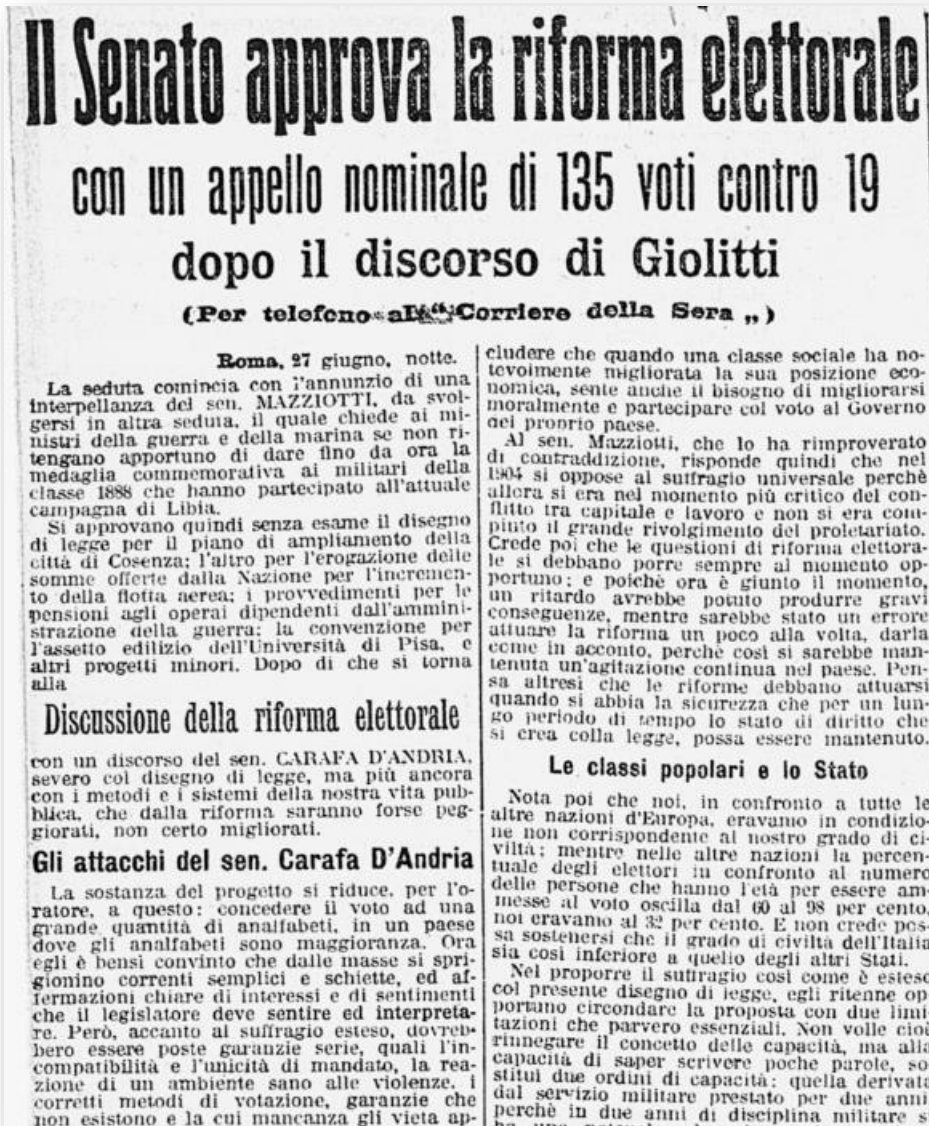
Corriere della Sera , 28 giugno 1912, p. 2 (archivio.corriere.it)

( Atti parlamentari , Camera, XXIII legislatura [tornata antimeridiana del 19 giugno 1912], p. 21149) 136 .