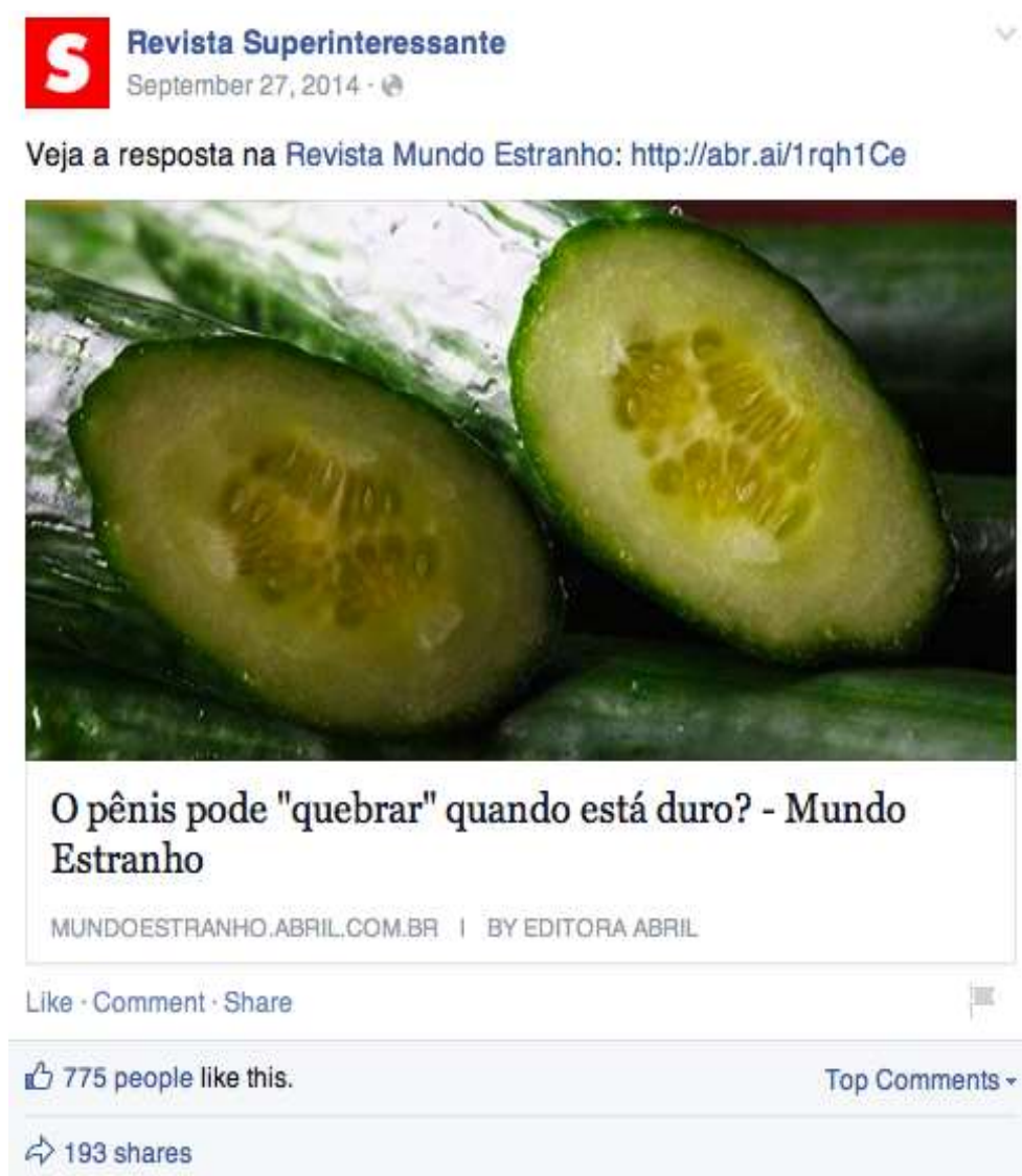
IMAGEM 1: Imagem e humor na Superinteressante

Os gêneros digitais mais utilizados nas páginas de divulgação científica são basicamente: i) postagem ( post ); ii) capa ( cover ) e iii) comentários ( comments ) 5 . Cada um desses gêneros possui especificidades, como preponderância de conteúdo verbal, visual, sincretismo etc. Analisaremos primeiramente o gênero e o estilo da postagem, assim como sua composição e especificidades do material publicado pela revista Superinteressante em sua página na rede social.