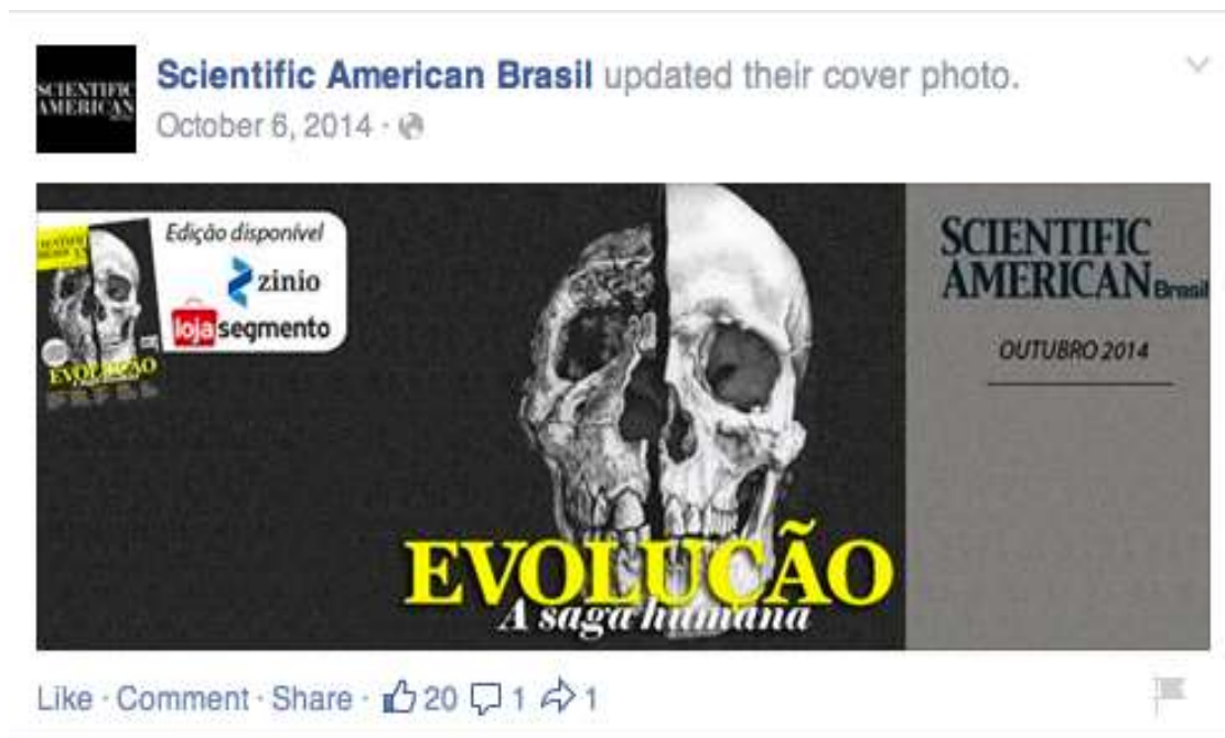
Figura 2: CAPA DA SCIENTIFIC AMERICAN BRASIL NO FACEBOOK

Facebook não contava com essa imagem nas páginas pessoais, institucionais ou comerciais, mas a partir de uma das atualizações da rede, ela passou a ser empregada não somente por usuários comuns, como por parte considerável das páginas de empresas, artistas, órgãos da imprensa etc.