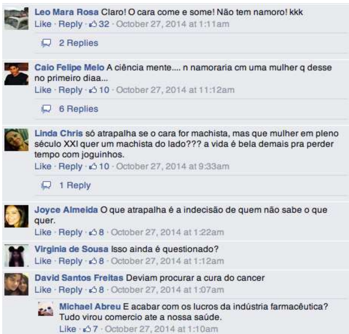
Figura 5: Comentários e réplicas dos usuários à publicação da Superinteressante