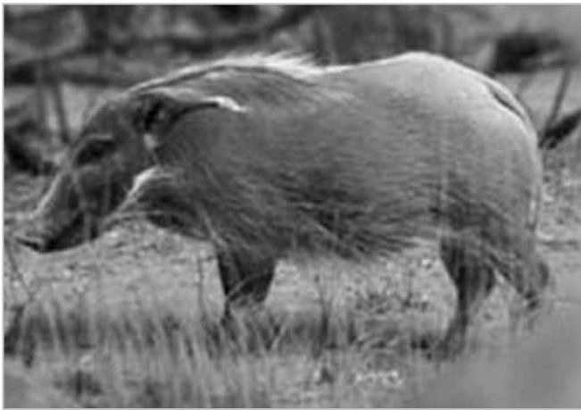
Fig. 3. Potamocero, Potamochoerus larvatus.

Si può notare, inoltre, che in varie edizioni dell' HA si afferma che la parte relativa al camaleonte ivi descritta è stata riassunta da Plinio (Louis 1964; Tricot 1987) e che Giannarelli (1983) asserisce che la fonte di Plinio per la descrizione del camaleonte è sicuramente Aristotele.