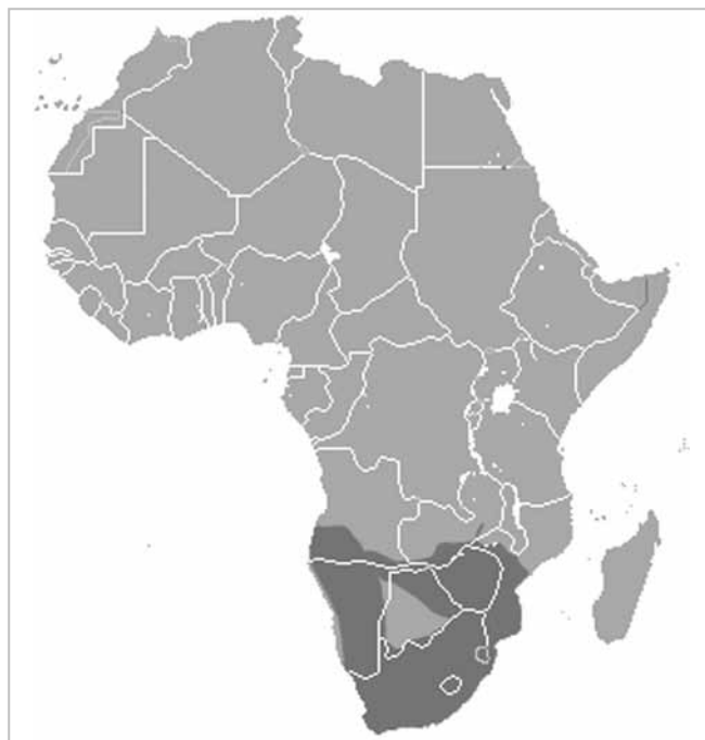
Fig. 4. Distribuzione del babbuino nero o del Capo, Papio ursinus (da Wikipedia, ridisegnato).