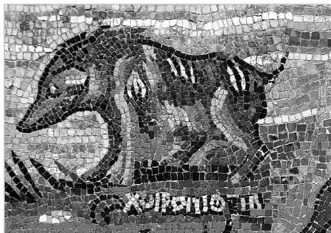
Fig. 2. Mosaico nilotico di Palestrina: particolare con iscrizione ΧΟΙΡΟΠΙΘΗΚΗ e figura di un suide.

Al fine di accertare l'unicità della figura zoomorfa affiancata dall'iscrizione choiropithec sono state osservate oltre 200 iconografie a soggetto nilotico (particolarmente pitture e mosaici) comprese tra il II sec. a.C. e il IV sec. d.C. (cfr. Versluys 2002; Salari 2006 e relative bibliografie). Per capire quali cognizioni zoologiche e biogeografiche sul continente africano possedevano i Greci tra il tempo in cui visse Aristotele e la realizzazione del MNP sono state consultate varie fonti scritte tra il V sec. a.C. e il III sec. d.C. e più o meno coeve alla scoperta del MNP. In particolare, oltre alle opere zoologiche di Aristotele e alla NH di Plinio, le parti descrit-