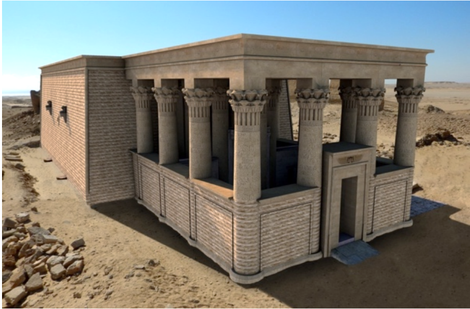
Ricostruzione virtuale del contra-temple Virtual reconstruction of the contra-temple نموذج افتراضي للمعبد الرئيسي

with two columns; the southern half, on the other hand, was divided into 3 rooms. In the central area there was a limestone and basalt chapel of which it was possible to propose a 3D reconstruction. Access to the contra-temple was allowed to the people who could directly address their prayers to the god.